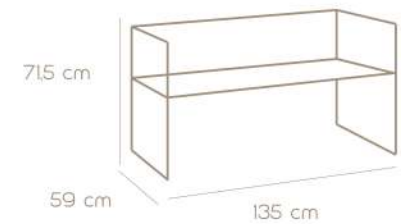
TAVOLINO SMALL TABLE

Material: Painted or anodized aluminum frame, wooden seat for outdoor use.